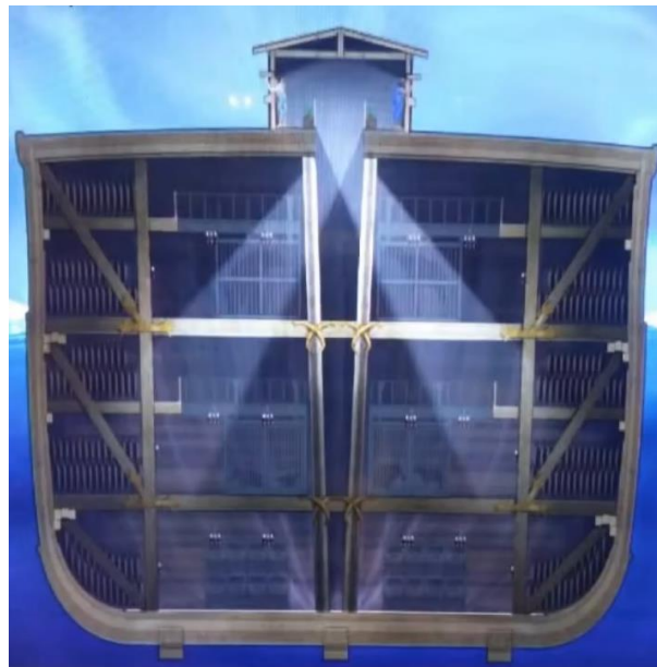
Abbildung 5 Querschnitt durch Rumpf der Arche (RL/Creation Museum)

16 Eine Lichtöffnung sollst du der Arche machen, und bis zu einer Elle sollst du sie fertigen von oben her; und die Tür der Arche sollst du in ihre Seite setzen; mit einem unteren, zweiten und dritten Stockwerk sollst du sie machen.