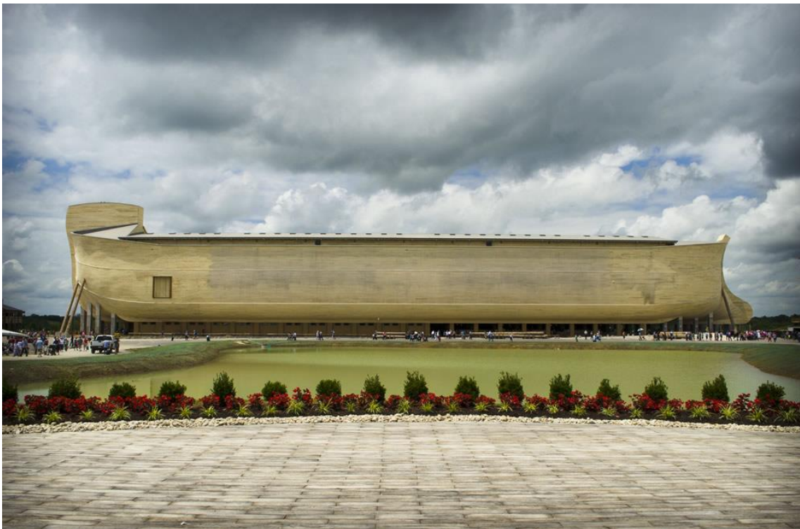
Abbildung 2 Nachbildung der Arche Noah im Massstab 1:1 Ark Encounter