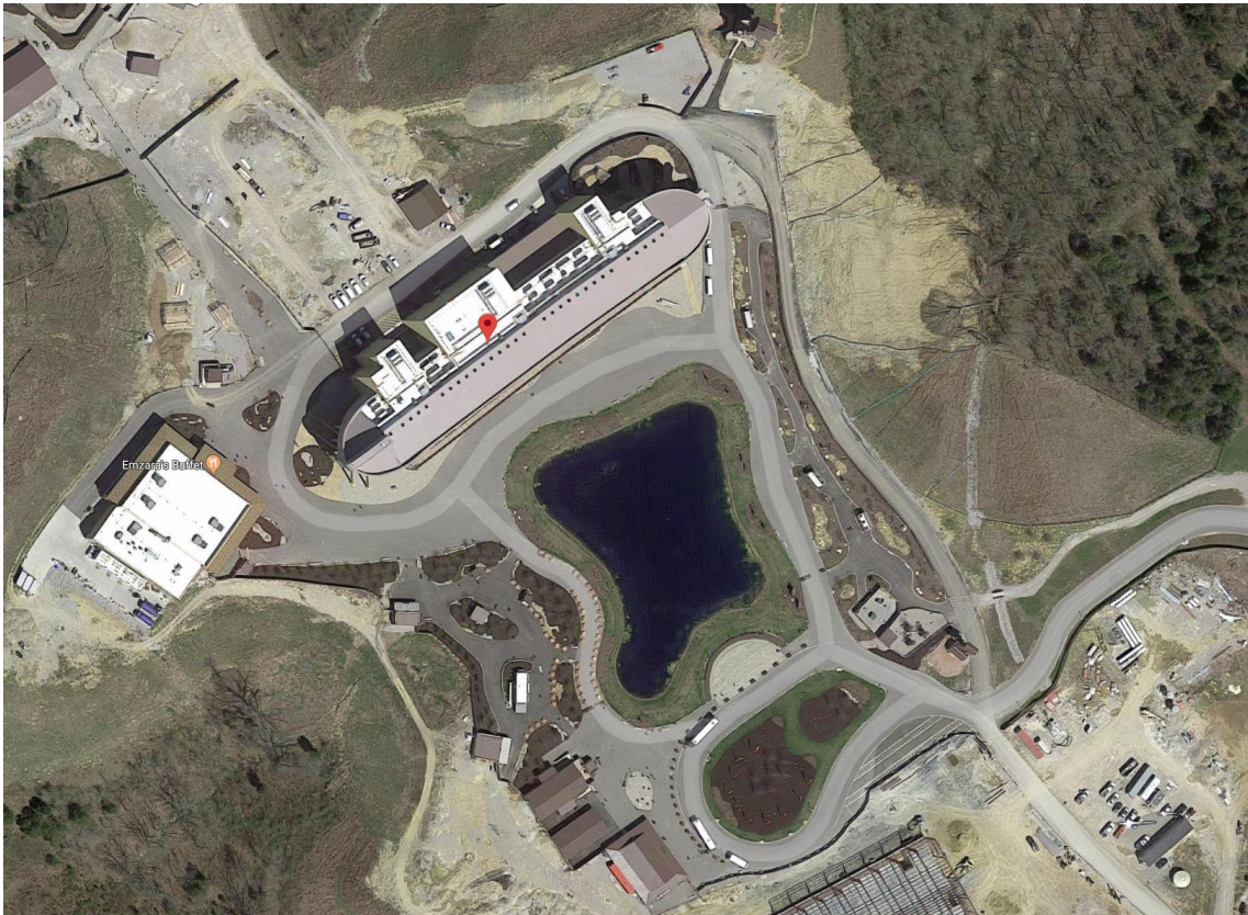
Abbildung 1 Ark Encounter, Kentucky (Ark Encounter -> Begegnung mit der Arche)