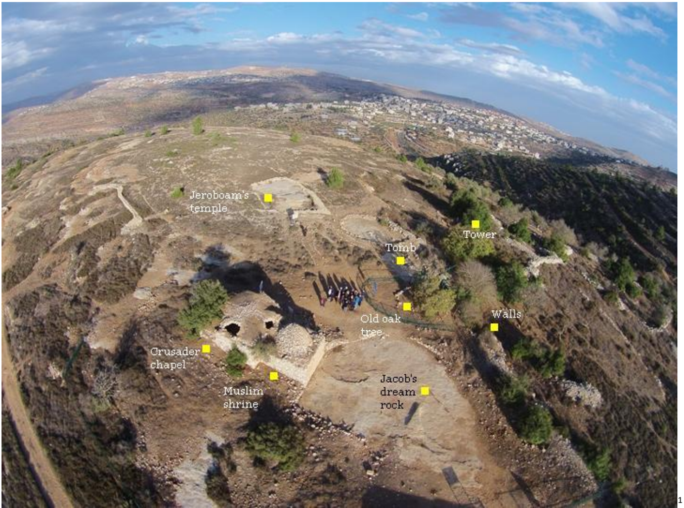
Der Ort Bethel